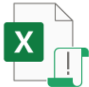
2021秋季記録会(一般用).xlsm