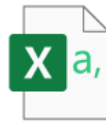
兵庫陸協(責任者氏名) 秋.csv